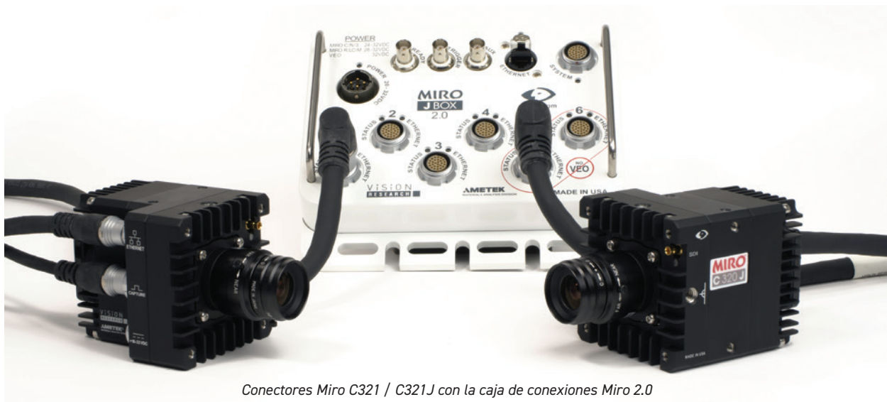
Conectores Miro C321 / C321J con la caja de conexiones Miro 2.0